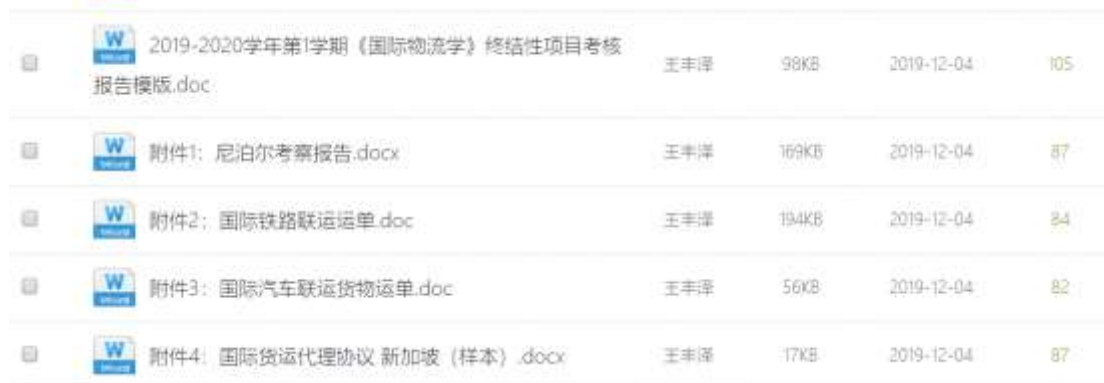
图 5. 实验实践操作课自主学习下载量