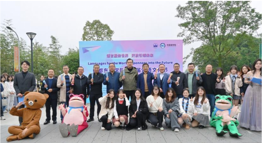
外语文化节开幕式

答：外语文化节是我院品牌素质教育项目，外语文化节立足“思想引领、文化浸润”，以“用外语讲好中国故事”为主线，通过国际文化展览、外语舞台剧、外文歌曲等品牌项目，将语言实践与价值塑造深度融合，引导学生在跨文化交流中厚植家国情怀，在文明互鉴中坚定文化自信。近五年累计举办赛事活动 100 余场，覆盖师生 3 万余人次，让中国声音通过青春力量传得更远、更响亮。