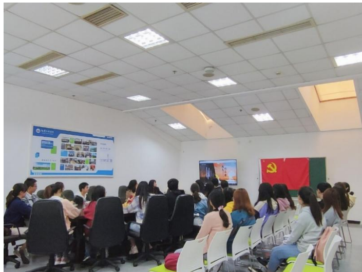
基层党支部开展“我是传承者”主题党日活动