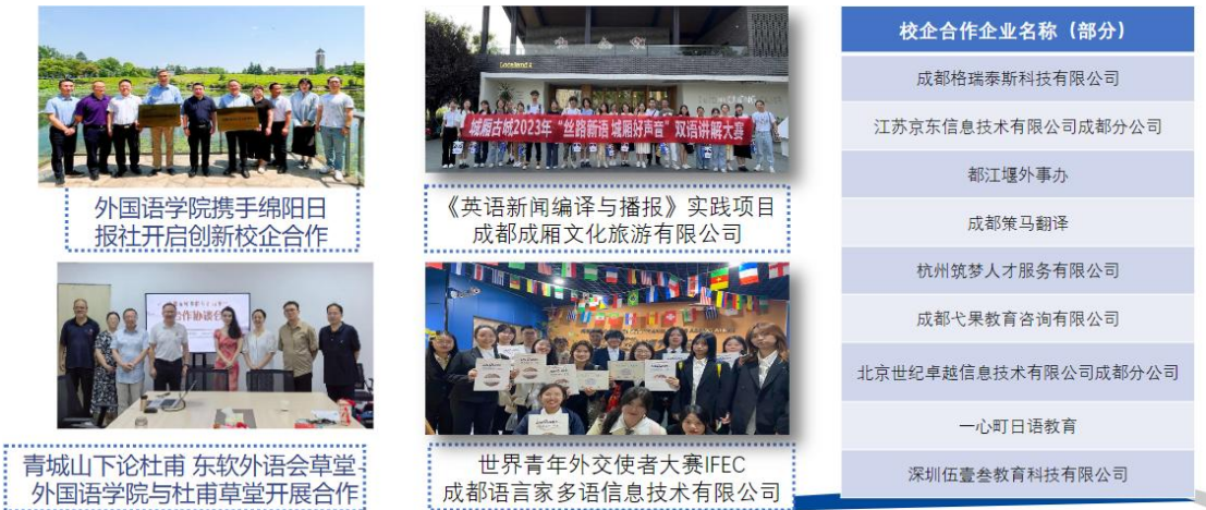
学院校企合作情况

答：外语文化节是我院品牌素质教育项目，外语文化节立足“思想引领、文化浸润”，以“用外语讲好中国故事”为主线，通过国际文化展览、外语舞台剧、外文歌曲等品牌项目，将语言实践与价值塑造深度融合，引导学生在跨文化交流中厚植家国情怀，在文明互鉴中坚定文化自信。近五年累计举办赛事活动 100 余场，覆盖师生 3 万余人次，让中国声音通过青春力量传得更远、更响亮。