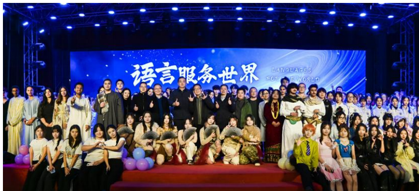
外语文化节闭幕式