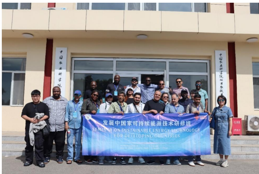
学生援外翻译志愿服务