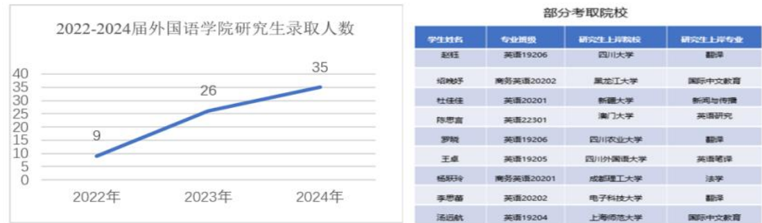
近三届 2022-2024 年研究生录取情况

研究生录取人数逐年增加：毕业生 1344 人，73 人被国内外高校录取为研究生。